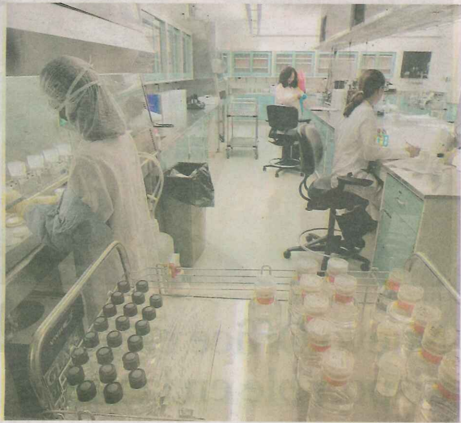
LAS ESTADÍSTICAS revelan que los sectores que antes fueron pilares en la creación de trabajos ahora se encuentran del lado de los perdedores.