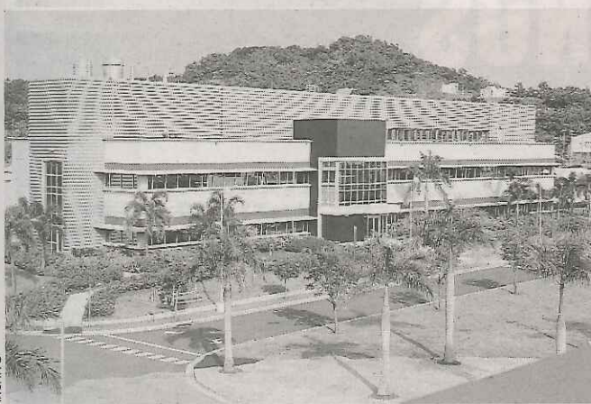
AMGEN FIGURA entre la cartera de clientes de Ultimate Solutions.

Al momento, hay otras 45 solicitudes pendientes de procesar, las que generarían 735 empleos adicionales. La meta es crear 50,000 nuevos empleos en 18 meses.